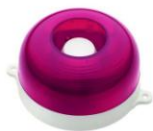
МАЯК-12-КП, МАЯК-24-КП оповещатель комбинированный